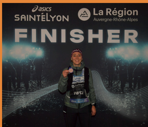
Sainté Lyon 2024 et 2025